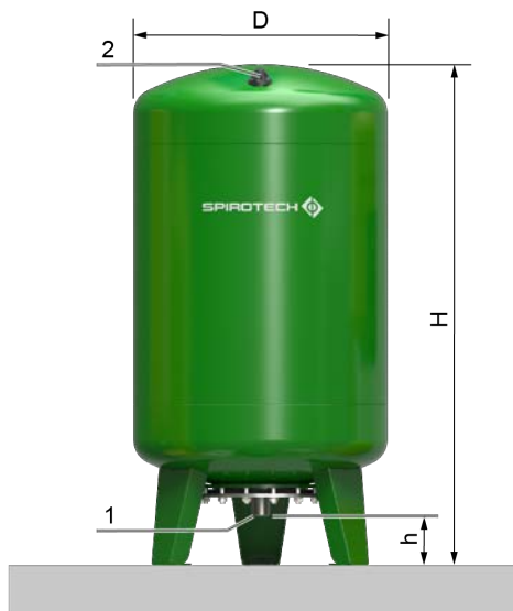
EVSolar 90 .. EVSolar 300