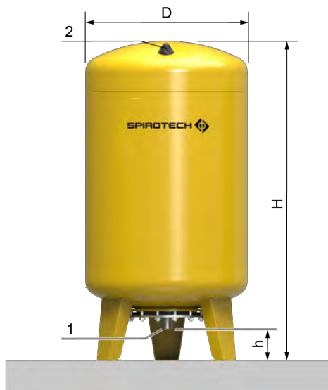
EVU6-90 .. EVU6-300