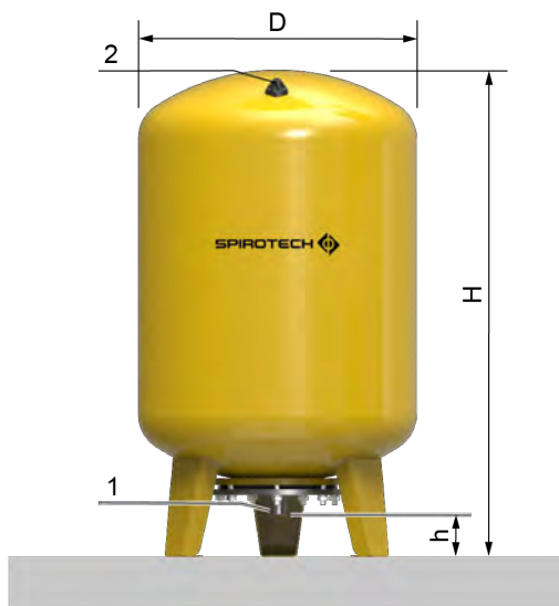
EVU10-120 .. EVU10-300