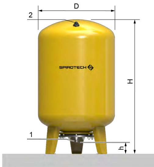
EVU10-120 .. EVU10-300