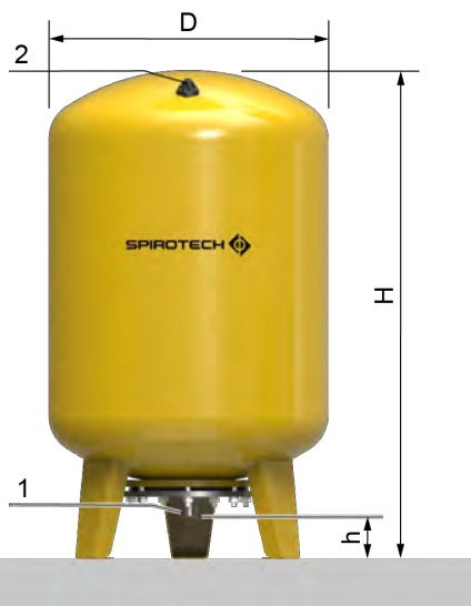
EVU10-120 .. EVU10-300